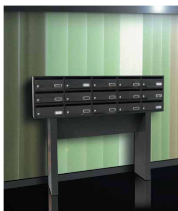
Modelo Imperio 41 - Madera