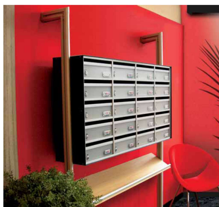
Modelo Imperio 17 - Brazos