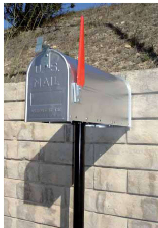
Modelo Dakota 1