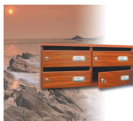
Modelo Nature 8