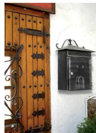
Modelo Forja 1

Rambla de Catalunya, 43 08007 - BARCELONA