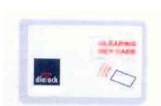
Tarjeta de programación roja