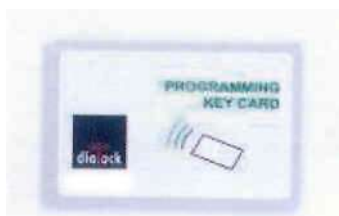
Tarjeta de programación verde

Cerradura electrónica para mueble. Funcionamiento con batería. Al presentar la tarjeta de proximidad la cerradura se abre. Con la tarjeta de programación se pueden dar de alta o baja a los distintos usuarios.