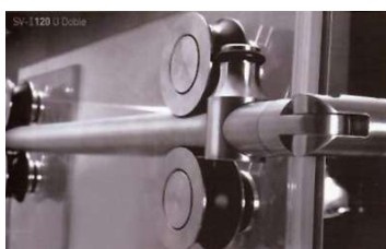
SV-I120 U Doble

Se trata de un mecanismo de divisiones y puertas de vidrio, con un rodamiento de acero inoxidable, para puertas correderas de cristal, dobles y simples, de hasta 120 kg de peso, para vidrios de entre 8 y 10 mm, especialmente indicado para puertas de paso e instalaciones de duchas en baños.