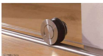
SV-I120 U Terra

Se trata de un mecanismo de divisiones y puertas de vidrio, con dos rodamientos dobles de acero inoxidable, para puertas correderas de cristal, dobles y simples, de hasta 120 kg de peso, para vidrios de entre 8 y 10 mm, especialmente indicado para puertas de paso e instalaciones de duchas en baños.